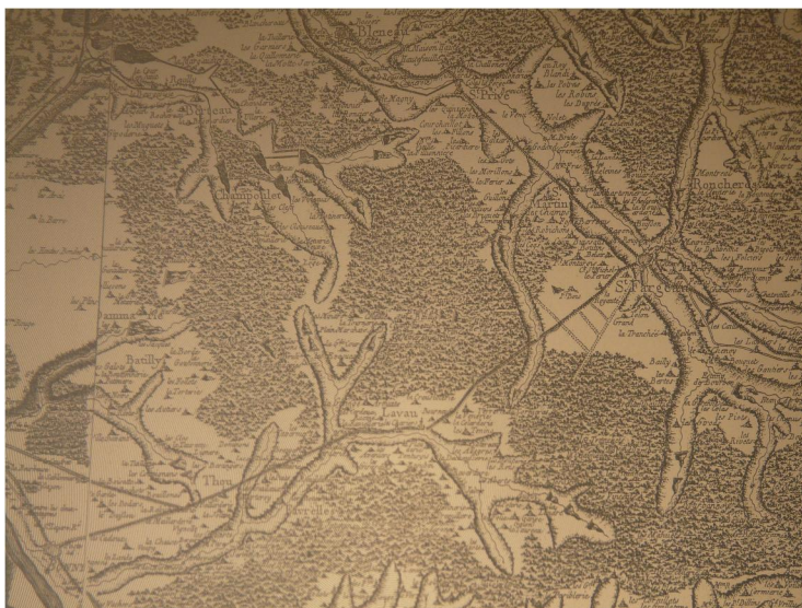
Les étangs de Puisaye sur la carte de Cassini