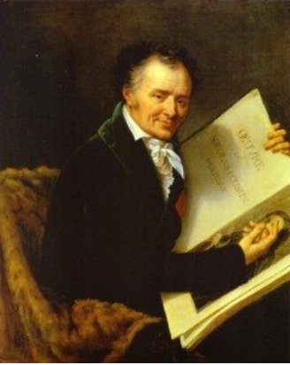
Vivant Denon (1747 – 1825)